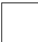
Huella Índice Derecho

CAMPANA DE NOTIFICACIONES. En la parte superior derecha, se encuentra una campana que visualiza dos notificaciones, la de vehículos con documentos vencidos y conductores con documentos vencidos, no tiene ninguna otra función, solo es informativa.